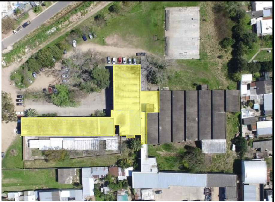
SECTOR A INTERVENIR